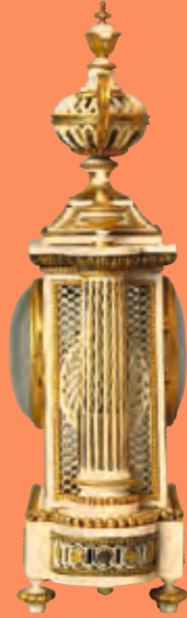
Pendule en ivoire, tournée par le roi Louis XV.