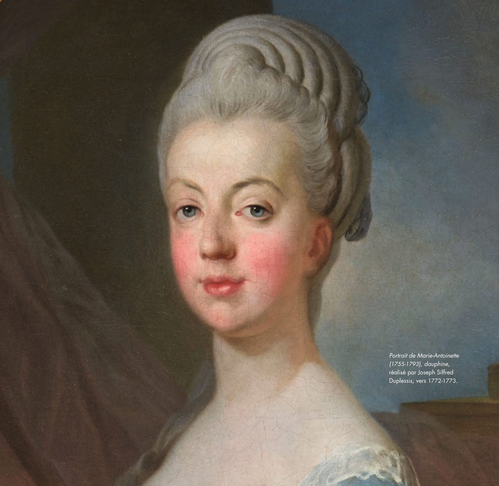
Portrait de Marie-Antoinette (1755-1793), dauphine, réalisé par Joseph Siffred Duplessis, vers 1772-1773.